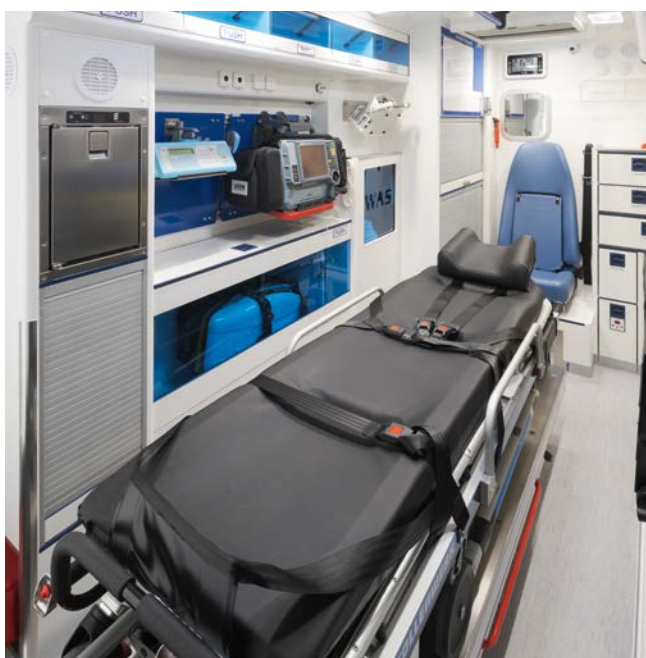
Der große Patientenraum ermöglicht die Unterbringung des kompletten medizinischen Equipments.